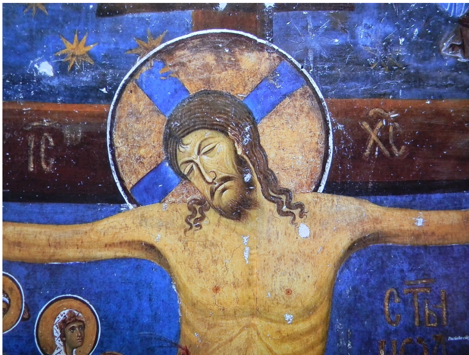
Studenica (Serbie) 14 e Siècle

Ultérieurement et d'une manière généralisée à partir du XI e siècle, Jésus sera représenté sur la croix les yeux fermés , la tête inclinée et le corps dénudé, un simple tissu noué autour de la taille. Ce changement important sert à insister sur l'aspect naturel de la mort du Fils de Dieu, conformément à la condition mortelle de tout