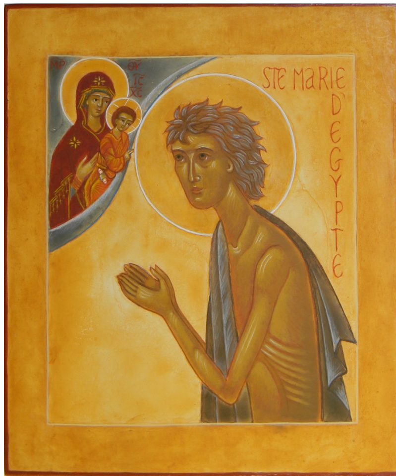
Sainte Marie l'Égyptienne