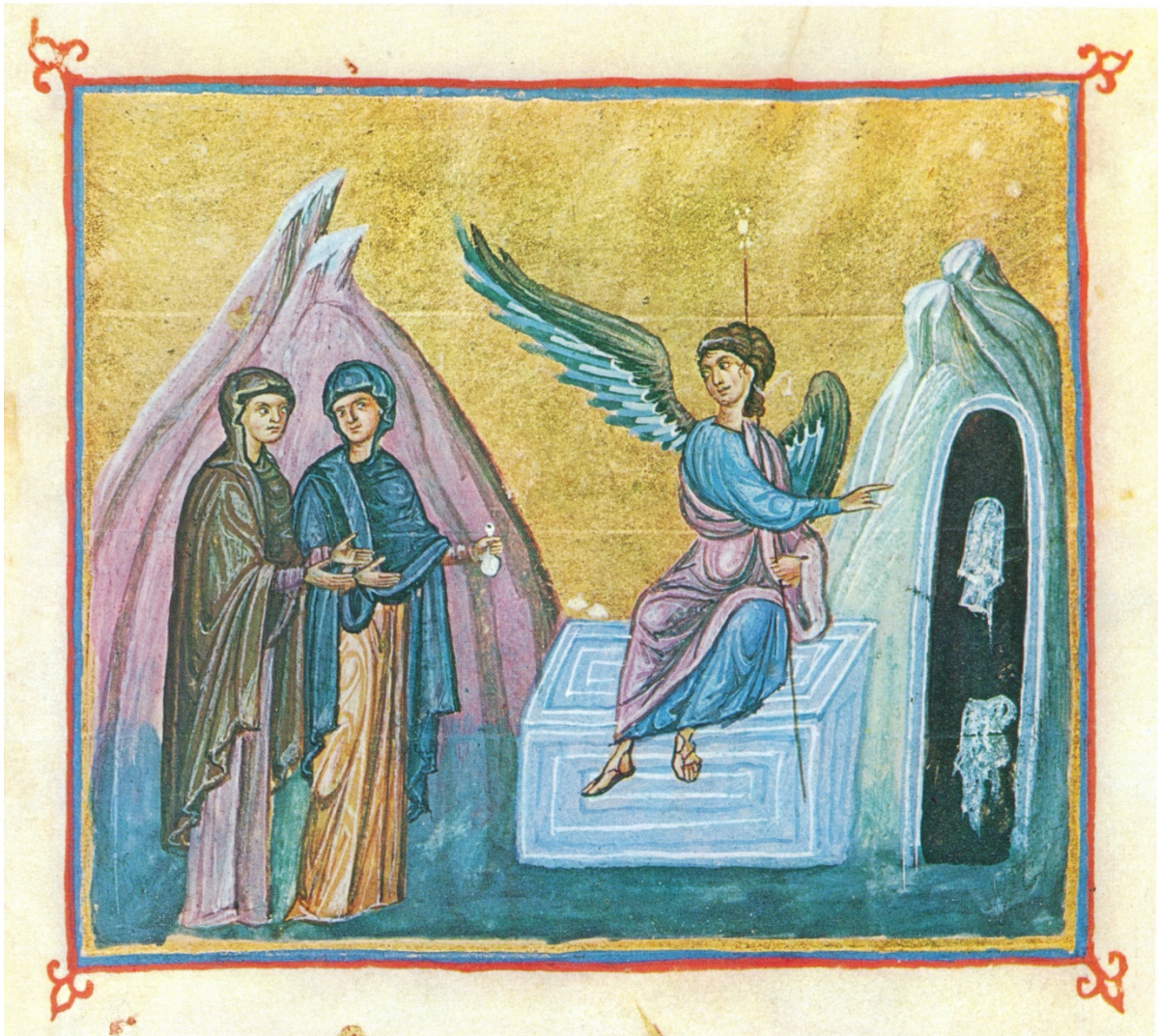
Illustration de Ms extraite de The Treasures of Mount Athos : Illuminated Manuscripts Miniatures Headpieces Initial Letters Volume I :The protaton and the Monasteries of Dionysiou, Koutloumousiou, Xeropotamouand Gregorion , 1974, p. 217.